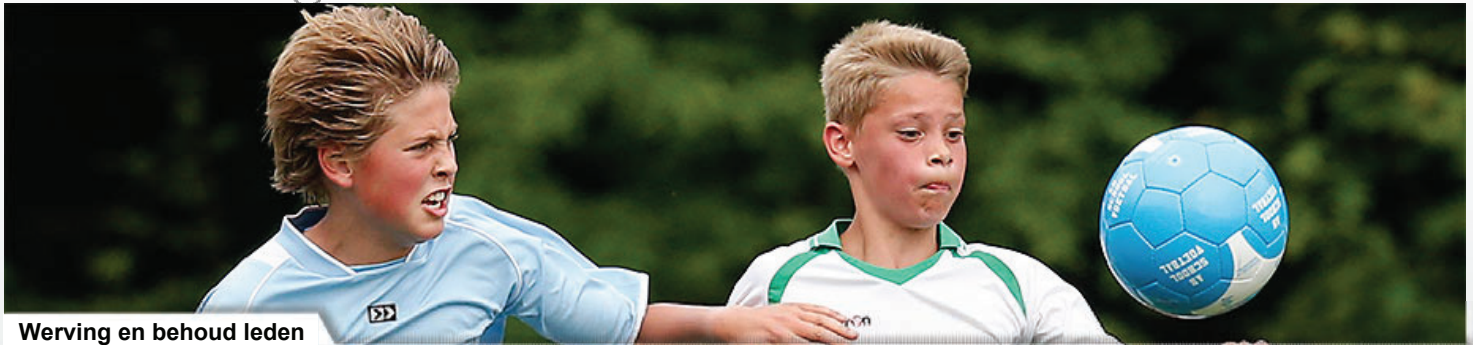
Werving en behoud leden